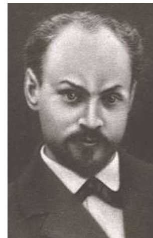
Григорий Андреевич Гершуни