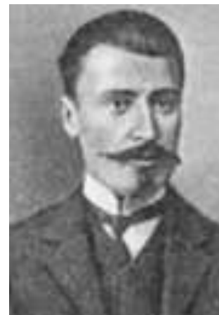
Иракий Георгиевич Церетели