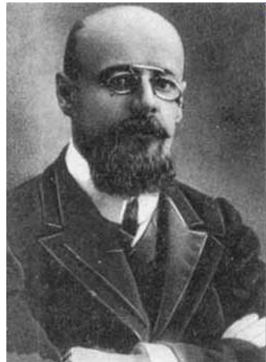
Владимир Митрофанович Пуришкевич