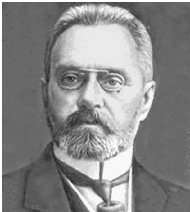
Александр Иванович Гучков, председатель