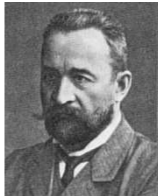
Князь Георгий Евгеньевич Львов