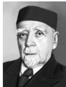
Глеб Максимилианович Кржижановский