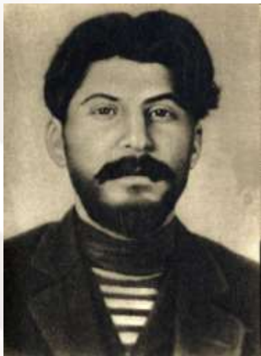
Иосиф Виссарионович Сталин (Джугашвили)