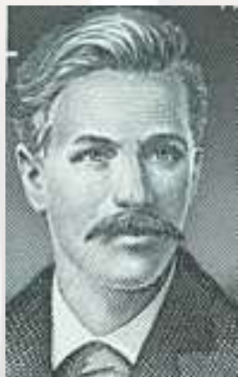
Иван Васильевич Бабушкин