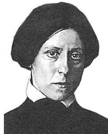
Мария Александровна Спиридонова