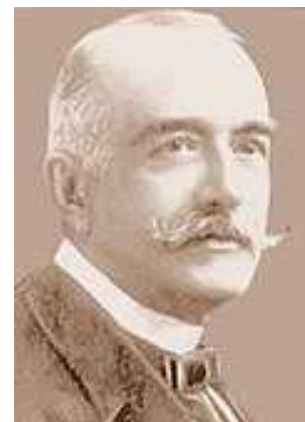
Сергей Андреевич Муромцев