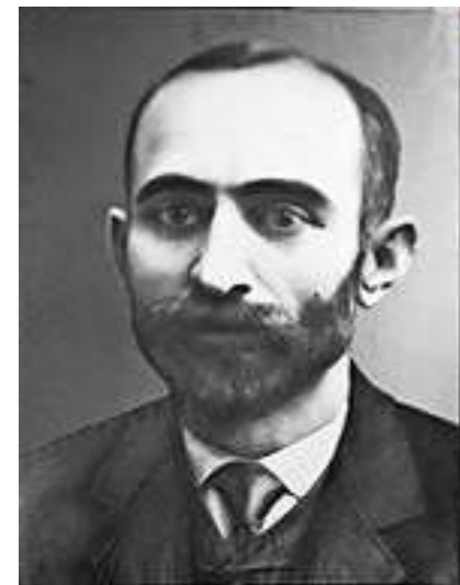
Николай Семёнович Чхеидзе