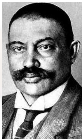
Евно Фишелевич Азеф