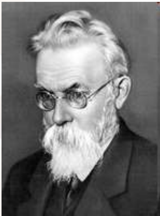
Владимир Иванович Вернадский