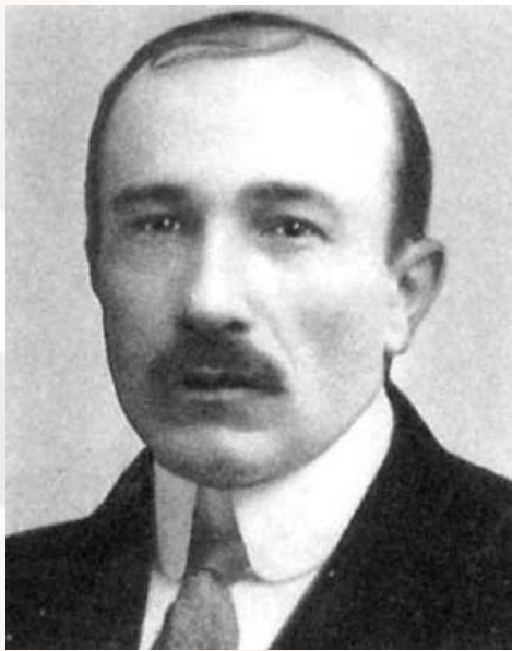
Борис Викторович Савинков