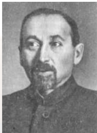
Фёдор Ильич Дан