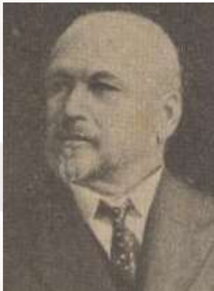
Михаил Владимирович Родзянко