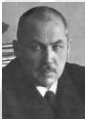
Николай Алексеевич Хомяков