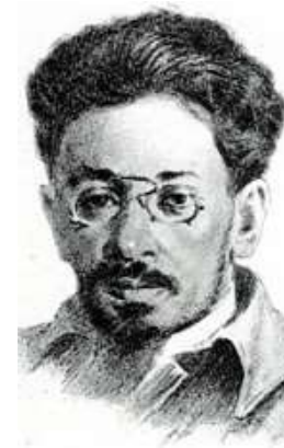
Яков Михайлович Свердлов