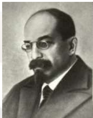
Анатолий Иванович Луначарский