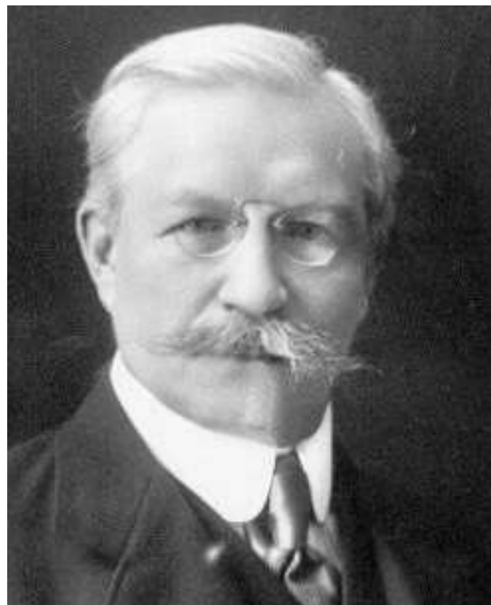
Павел Николаевич Милюков, председатель