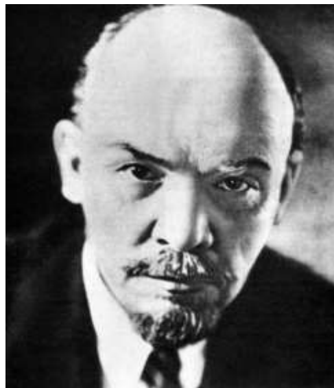
Владимир Ильич Ленин (Ульянов), председатель