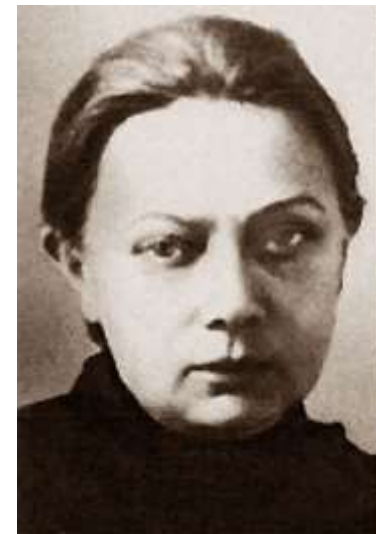
Надежда Константиновна Крупская (жена Ленина)