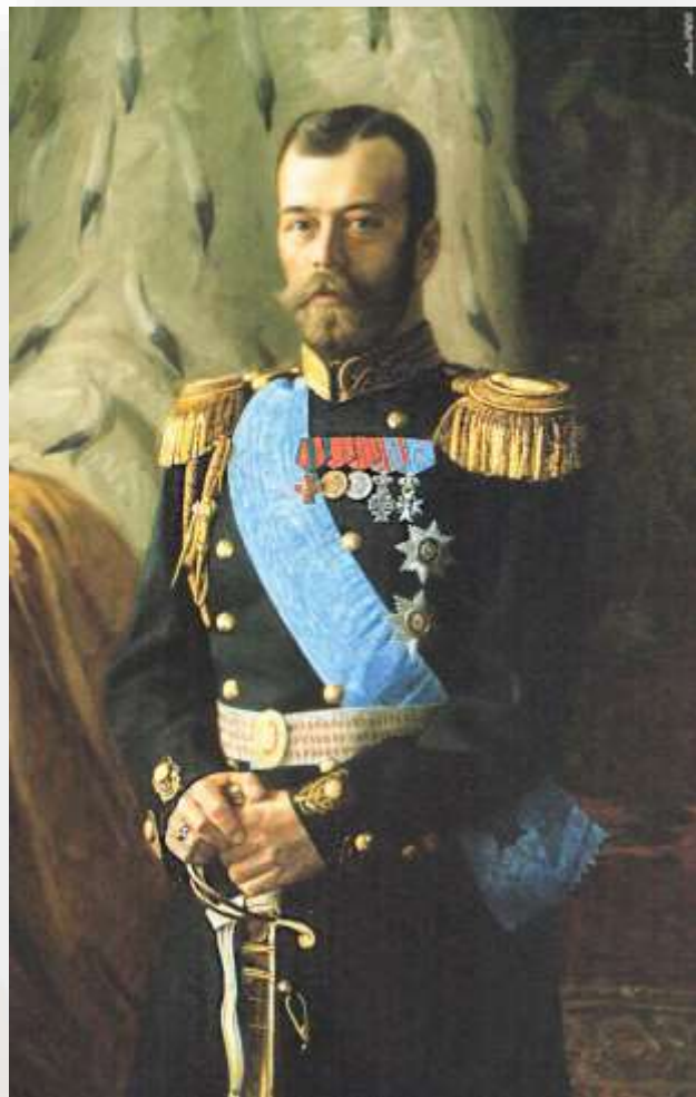
Николай II (1868-1918)