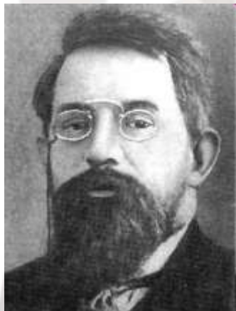
Пётр Бернгар- дович Струве