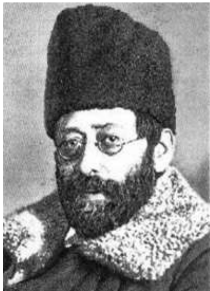
Юлий Осипович Мартов (Цедербаум), председатель